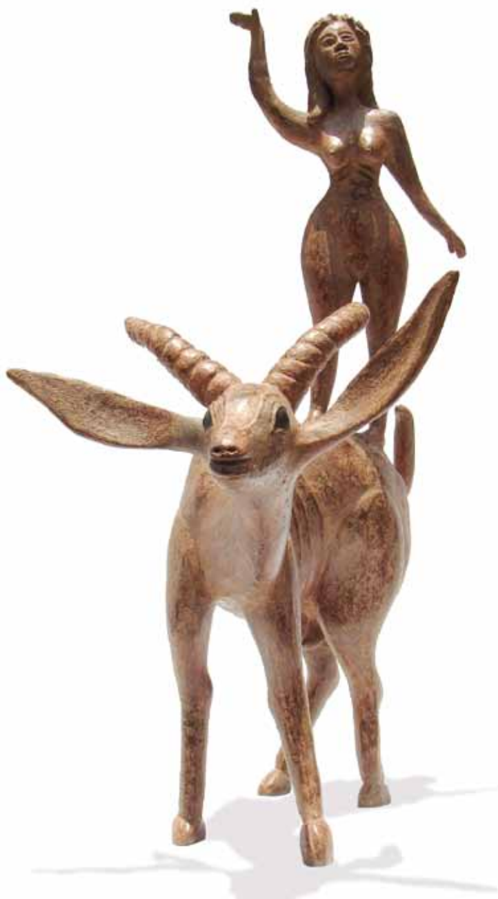
“Cabalgando sin destino” 0.55 m largo, 0.70 m alto, 0.30 m ancho Técnica Mixta