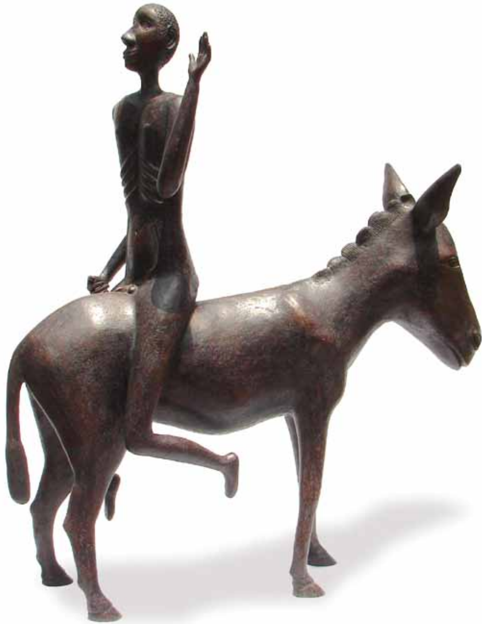
“Vive la vida... como quieras” 0.85 m largo, 0.97 m alto, 0.32 m ancho Técnica Mixta