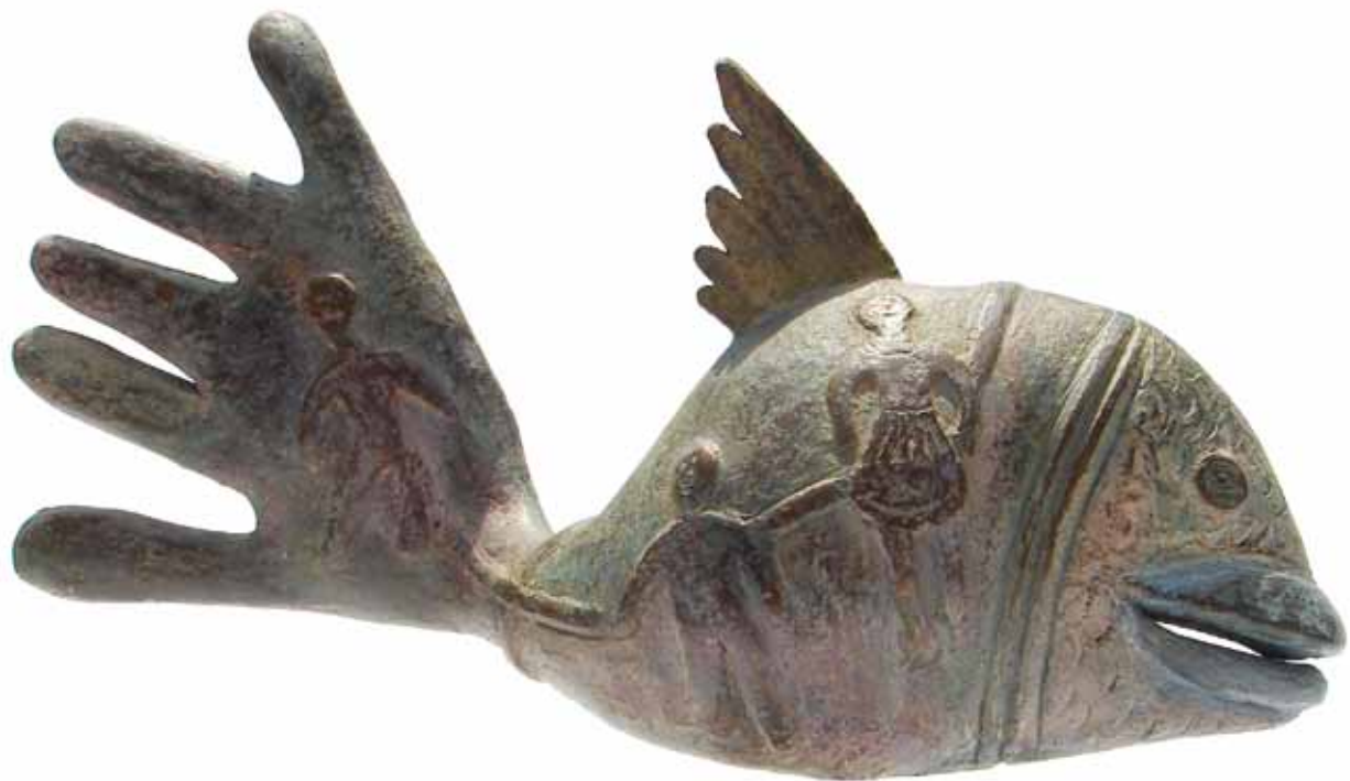
"Pez mano" 0.38 m largo, 0.27 m alto, 0.10 m ancho Técnica Mixta