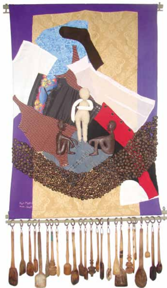
Collage con cucharas de madera 1.02 m x 1.50 m Tela, hilo, matatena