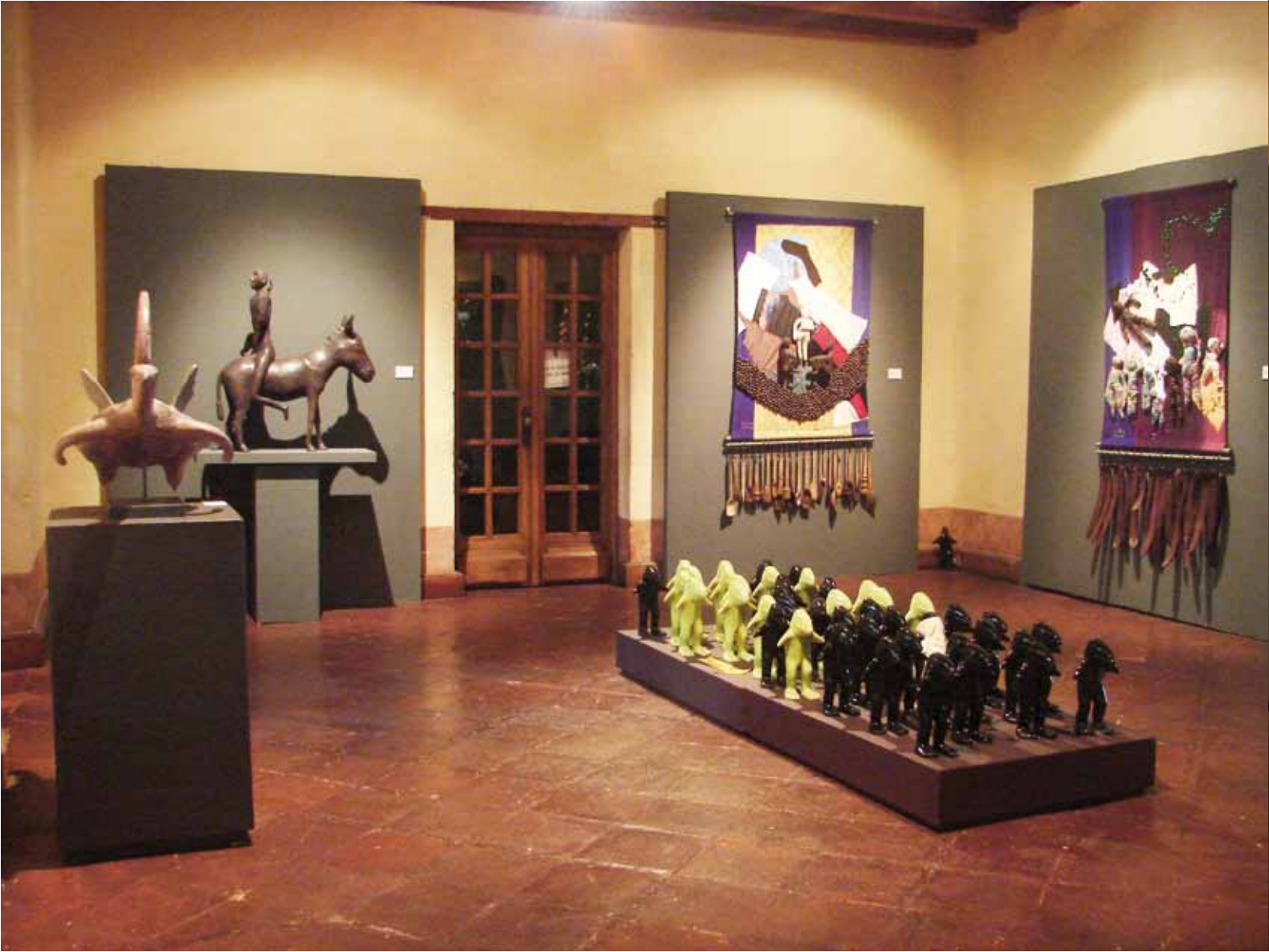
“Marcha de hombres pez hacia Cuajinicuilapa” 0.30 m x 0.15 m x 0.16 m Cerámica en alta temperatura