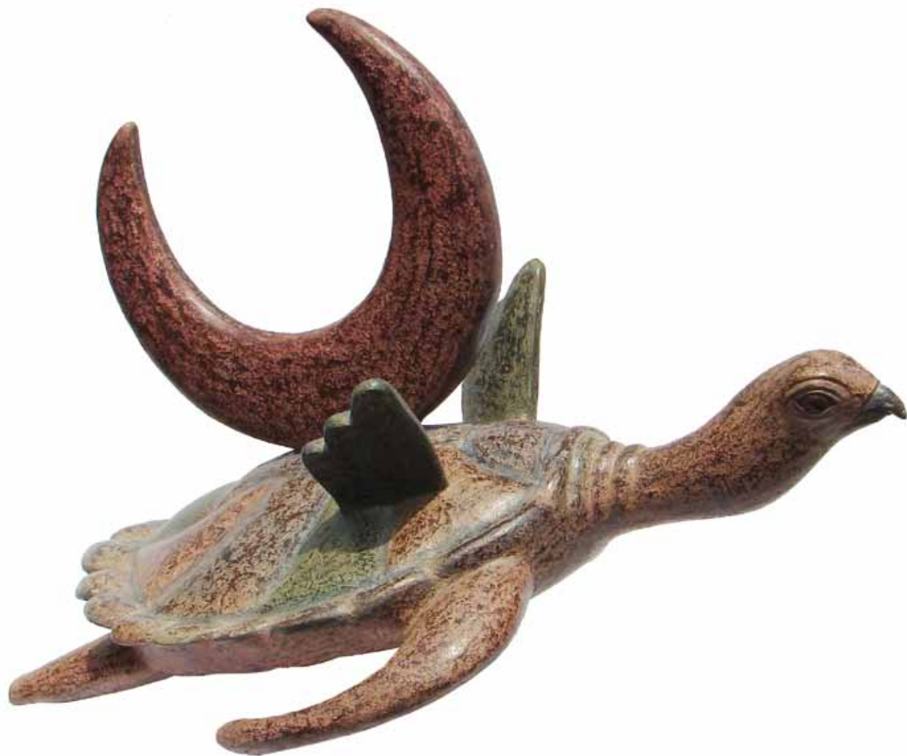
“El vuelo de la tortuga” 0.76 m largo, 0.60 m alto, 0.50 m ancho Técnica Mixta