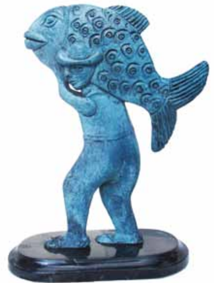
Gelasio con pez

Serie Gelasio 0.20 m largo, 0.30 m alto, 0.02 m ancho Técnica Bronce