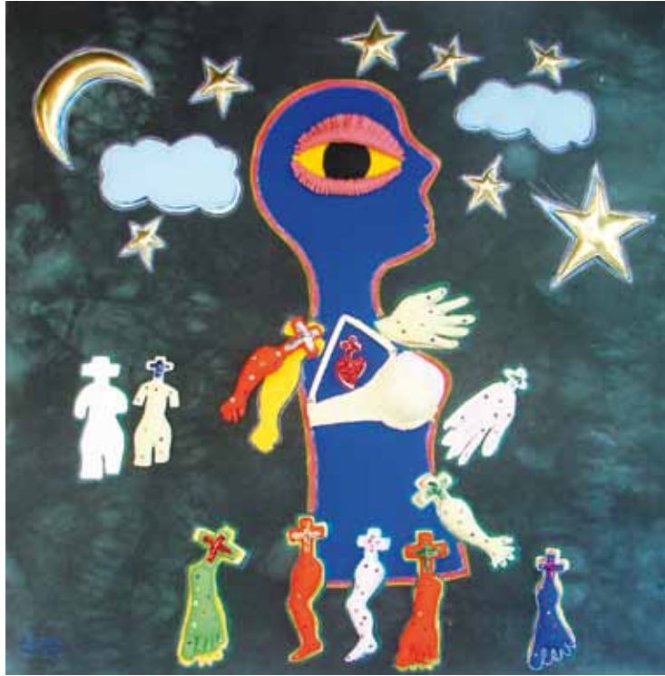
Collage "Autorretrato" 1.40 m x 1.40 m Tela, hilo