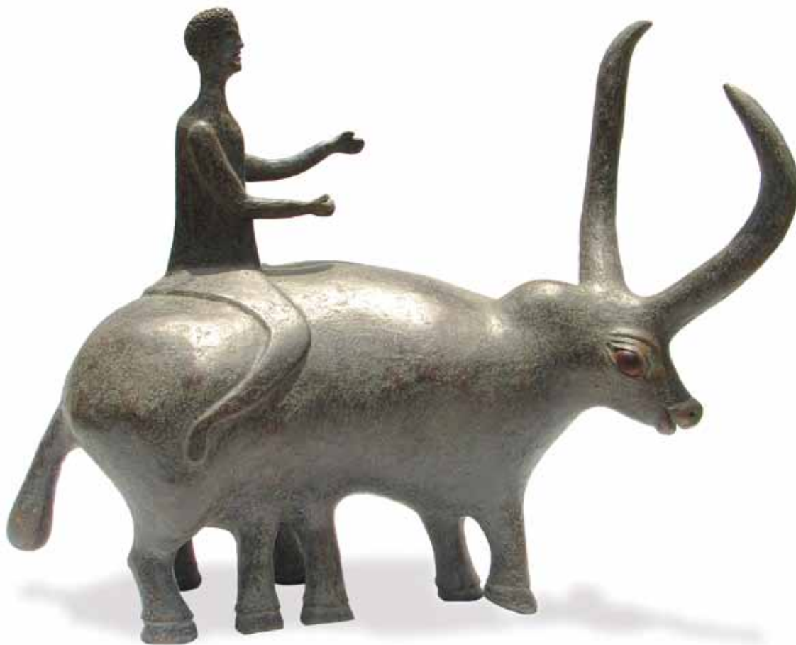
"Cleto en la toreada"

0.60 m largo, 0.50 m alto, 0.25 m ancho Técnica Mixta