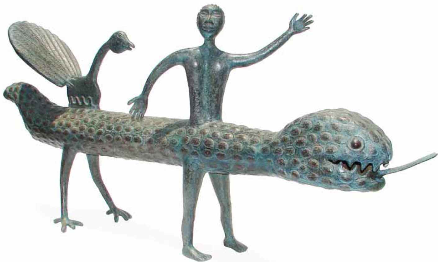
“Dragón tragón” 1.25 m largo, 0.56 m alto, 0.25 m ancho Técnica Mixta