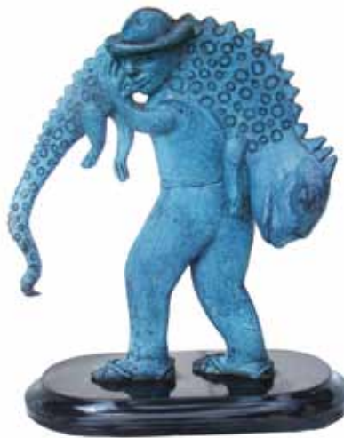
Gelasio con iguana