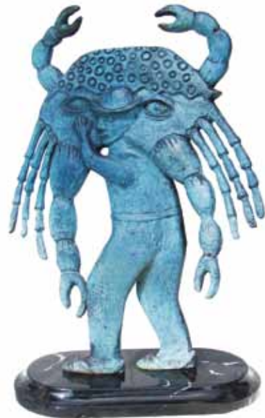
Gelasio con cangrejo