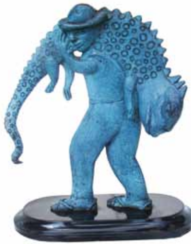
Gelasio con iguana