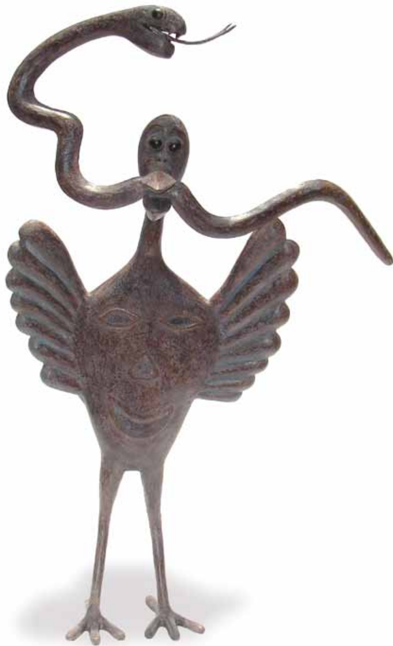
“Garza cazadora” 0.65 m largo, 0.95 m alto, 0.30 m ancho Técnica Mixta