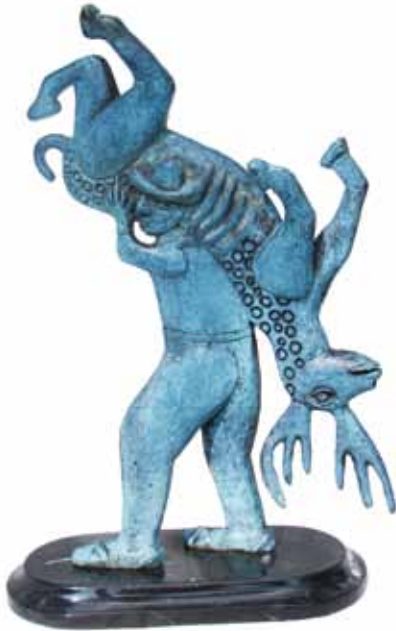
Gelasio con venado