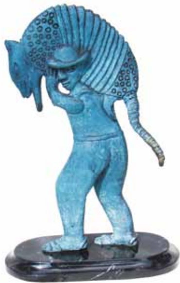
Gelasio con armadillo