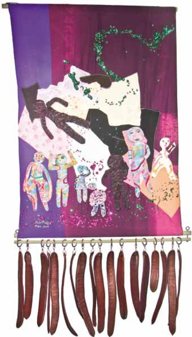
Collage con vainas de tabachin 1.02 m x 1.50 m Tela, hilo y lentejuela